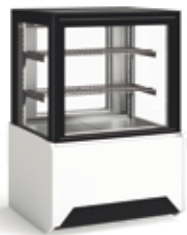
Gelados Ice Cream