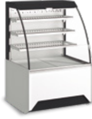
Grab & Go